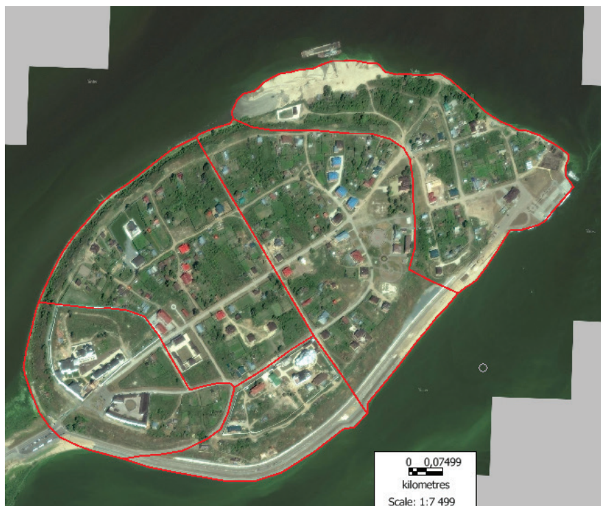
Рис. 3. Границы культурно-ландшафтных комплексов Свяжска

В состав комплекса входят: Успенский Богородицкий монастырь, Конный двор, фрагменты сохранившейся традиционной застройки, а также крутые склоны Свяжского острова, обращенные к затопленной реке Щуке, и двух-уровневая набережная, высокого (улица Набережная р. Щуки) и низкого уровней. Важным пространственным элементом Успенского культурно-ландшафтного комплекса является Успенский спуск, ныне на нем сооружена лестница, по которой посетители от автостоянки попадают на Успенскую площадь.