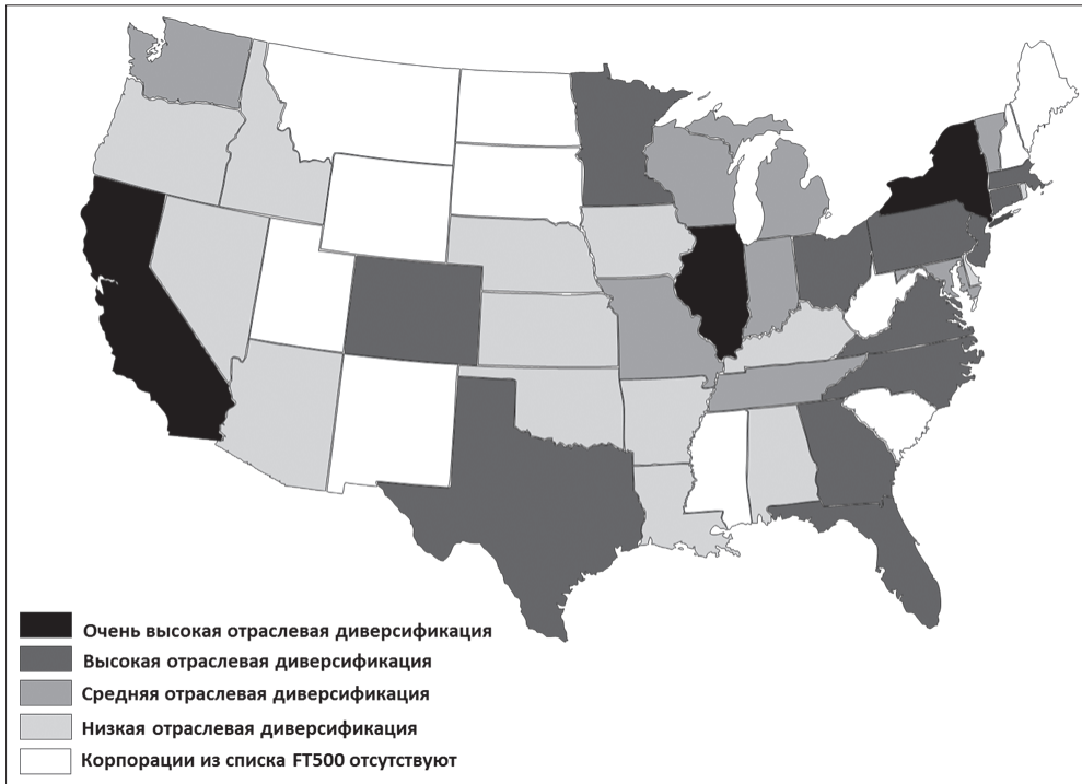
Рис. 2. Уровень отраслевой диверсификации штатов в соответствии с представленными в них крупнейшими корпорациями (составлено автором по [15])

Важно также отметить, что крупнейшие корпорации США являются вертикально интегрированными структурами, то есть в своем составе они имеют подразделения, позволяющие осуществлять весь процесс создания добавленной стоимости: от создания концепции продукта до его дистрибуции. Так, нефтяные корпорации занимаются как добычей нефти, так и производством нефтепродуктов. Компании пищевой и табачной промышленности занимаются выращиванием сырья и производством готовых продуктов. Такая структура позволяет им чутко реагировать на конъюнктуру рынка и быстро перестраиваться в соответствии с происходящими изменениями. Например, в случае, когда на нефть падает, прибыль добывающих подразделений в нефтяных компаниях уменьшается. Но нефтепереработка и нефтехимические подразделения, входящие в комплекс интеграции, увеличивают прибыль. Иными словами, потери одного подразделения компенсируются приобретением другого [9].