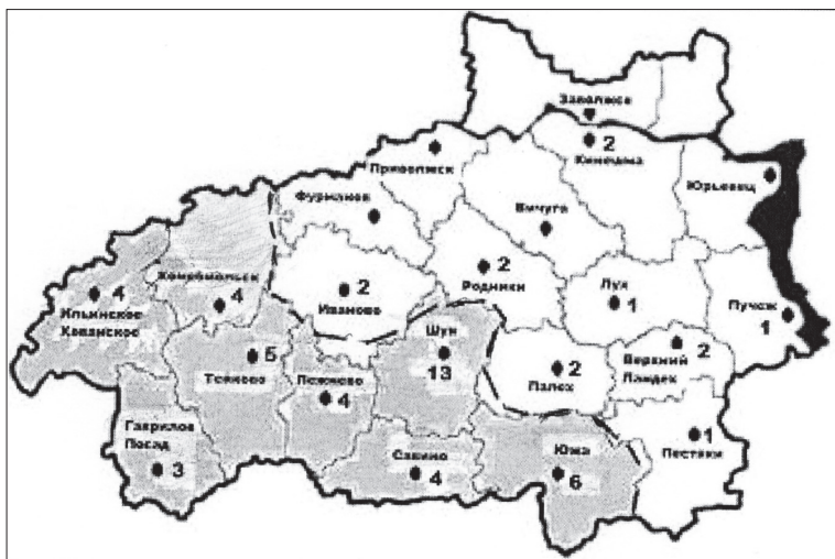
Рис. 1. Распределение сельских храмовых ансамблей по районам Ивановской области (цифры возле названий райцентров означают количество ансамблей в селах данного района)

В размещении рассматриваемых архитектурных комплексов наблюдаются определенные закономерности, на которых хотелось бы остановиться поподробнее. Из схемы на рисунке 1 видно, что большая часть храмовых ансамблей (43 из 56) располагается на юго-западе области, группируясь вокруг Шуи, Южи и Тейкова. Села, где они находятся, тяготеют к старинным трактам, соединявшим крупные торговые и ремесленные центры.