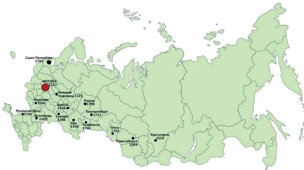
Рис. 1. Города-миллионеры России (2017 г.): размещение по территории и даты основания (составлено О.В. Шульгиной по источникам [1; 13])

миллионера, зафиксированные Всесоюзной переписью населения 1970 г.: Горький (Нижний Новгород), Свердловск (Екатеринбург), Самара (Куйбышев), Новосибирск. В 1979 г. эта группа городов-миллионеров пополнилась Челябинском и Омском, в 1989 г. в нее вошли Казань, Ростов-на-Дону, Уфа, Пермь; в 2002 г. — Волгоград, в 2012 г. — Воронеж, а в 2015 г. — Красноярск.