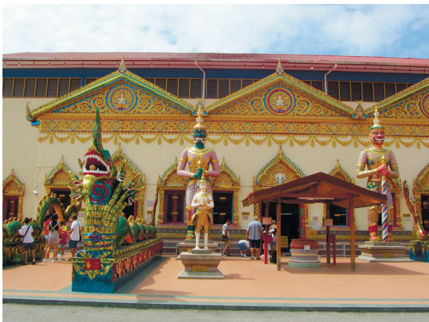
Фото 16. Тайский буддийский храм Чайямангкаларам.