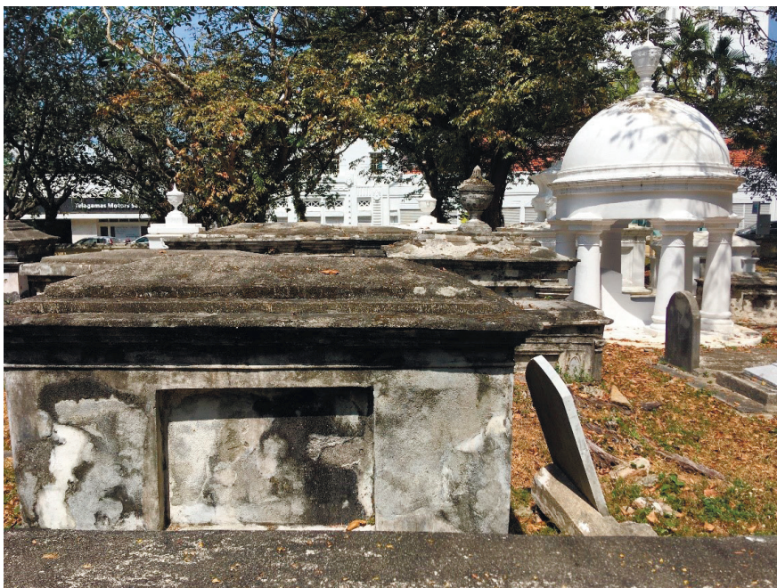
Фото 11. Протестантское кладбище Пинанга Northam Road Cemetery.