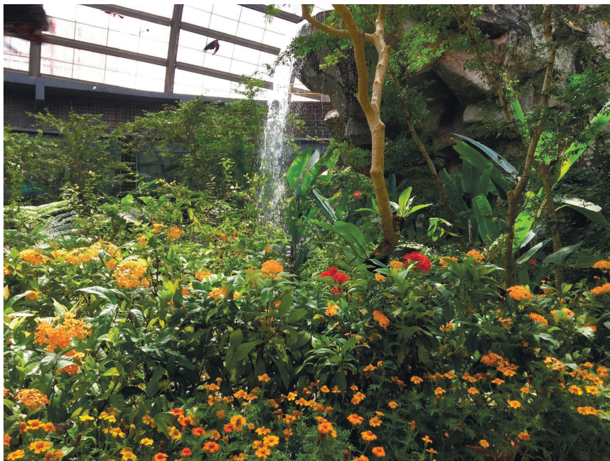
Фото 3. Парк бабочек «Энтопия».

Развлекательный туризм. На острове Пинанг отдыхающие могут посетить парк бабочек «Энтопия» (фото 3).