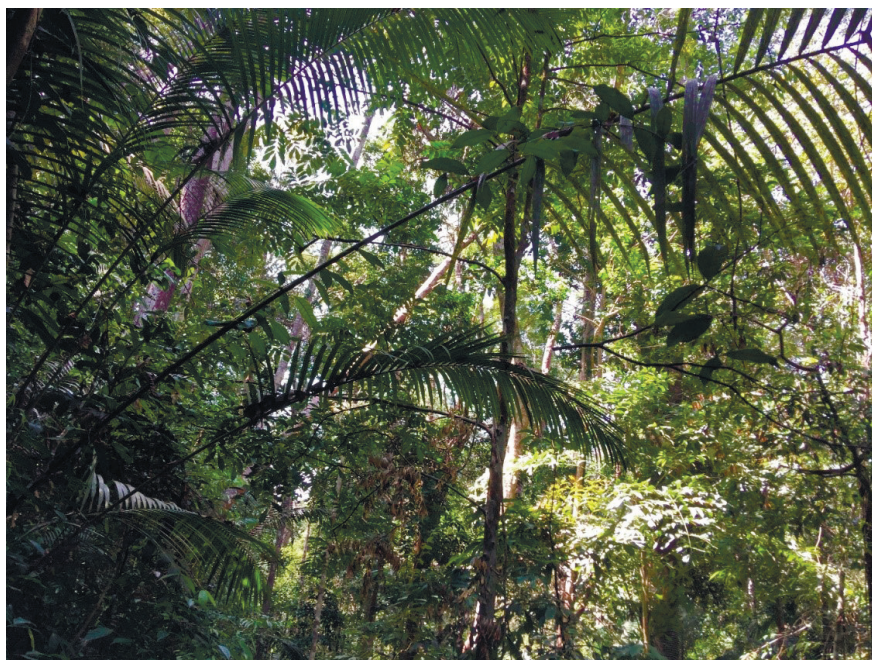
Фото 1. Национальный парк Пинанг.

Экологический туризм. Небольшой одноименный национальный парк находится на северо-западе острова Пинанг (фото 1).