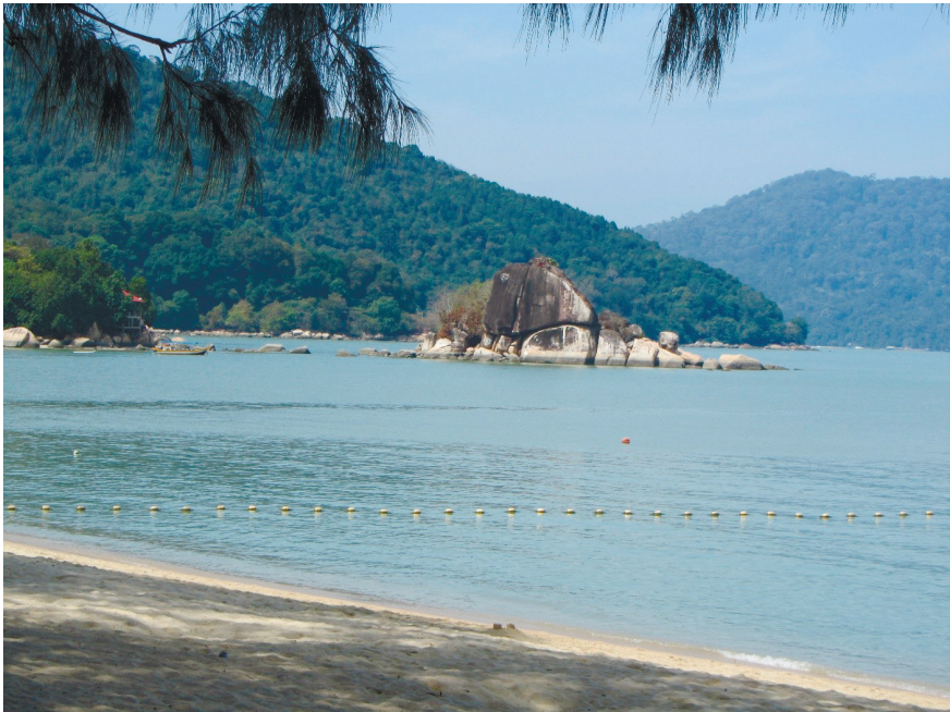
Фото 2. «Обезьяний» пляж на территории национального парка Пинанг.

Есть несколько менее известных пляжей на территории национального парка Пинанг. В воде у пляжа на северо-западе острова, выходящего на Малаккский пролив, рядом с небольшой станцией мониторинга морских черепах плавают ядовитые медузы, поэтому туристам купаться в этих местах не рекомендуют (хотя там открываются очень красивые виды, если кататься на моторной лодке). На другом пляже, который смотрит в сторону Телук-Баханга, отдыхающих могут побеспокоить обезьяны, да и сам пляж является скорее диким (фото 2).