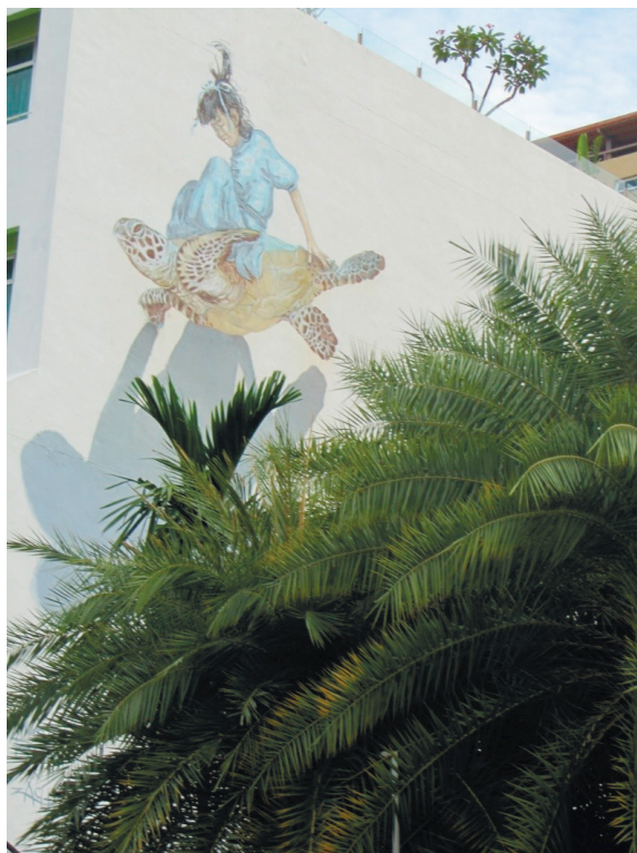
Фото 7. Стрит-арт на улицах Джорджтауна.