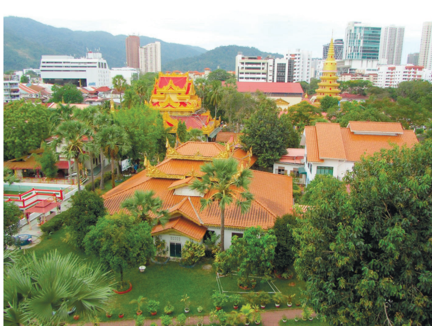
Фото 17. Бирманский храм Дхармикарама.

Бирманский храм Дхармикарама был построен в 1805 г., он стал первым из находящихся за пределами своей родины храмов (фото 17).