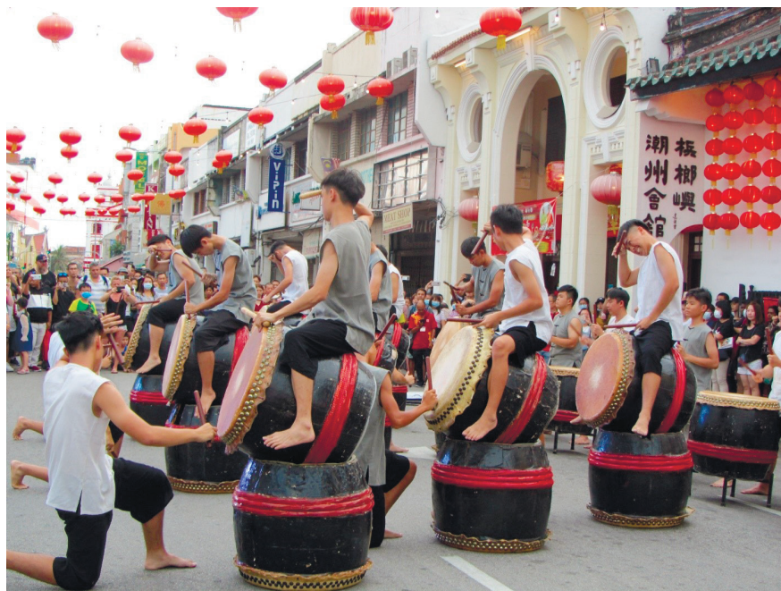
Фото 5. Празднование китайского Нового года в Джорджтауне.

В исторической части Джорджтауна в январе – феврале проводится красочное празднование китайского Нового года. Автор статьи и автор фото М. Б. Христова как-то однажды стали свидетелями представления барабанщиков и ансамбля песни, шествия с изображением дракона и мастер-классов, выступления уличных музыкантов, дегустации еды и многого другого (фото 5).