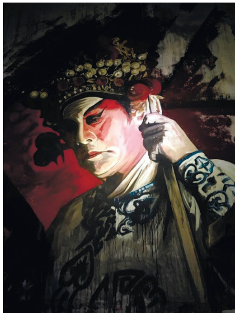
Фото 6. Рисунок на стене внутреннего помещения здания в Джорджтауне.