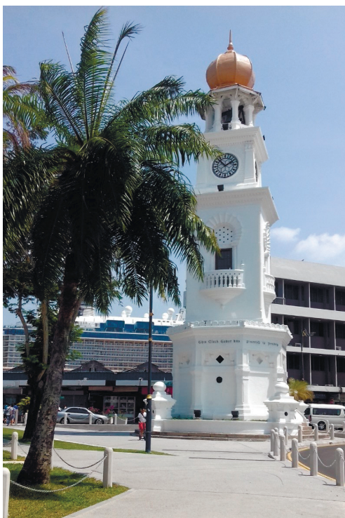
Фото 9. Мемориал Виктории у форта Корнуоллис.

засыпан в начале XX в. Стены форта имеют форму пятиконечной звезды, их высота достигает 3 м. Внутри Корнуоллиса туристы могут осмотреть тюрьму и часовню XIX в., несколько старых артиллерийских орудий (см. фото 10) и второй старейший маяк Малайзии, сооруженный в 1882 г.