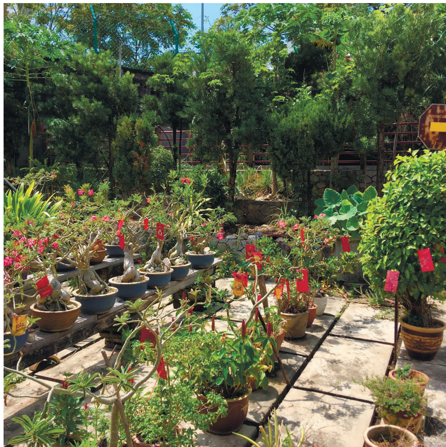
Фото 18. Сад бонсай на территории Храма змей.

На острове Пинанг, которому посвящена большая часть материала данной статьи, самым старым индусским храмом является храм Шри Мариамман, воздвигнутый в районе Джорджтауна (Малая Индия). Культурно-ритуальные действия проводятся здесь с 1801 г., а строительство храма было завершено 32 года спустя. Храм закрыт в дневное время, в 7.30 и 18.30 здесь проводятся пуджи (богослужения). На острове построены десятки других храмов и алтарей индусских божеств.