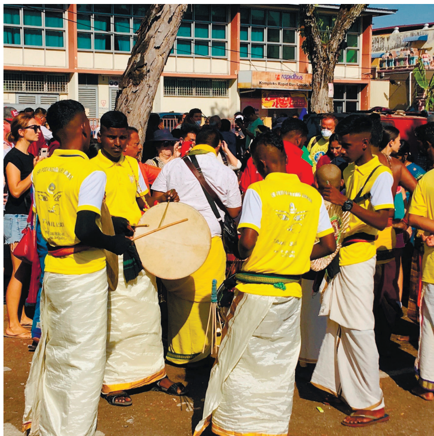
Фото 19. Празднование Тейпусама.

Из даосских храмов острова следует отметить Хайнаньский храм, храм Тянь Хор Кеонг, посвященный богине мореплавателей и торговцев Мадзу (см. фото 20), храм Хин Бу Теан, построенный на сваях, как и все поселение «Кланов пристани», храм Хоккиен Туа Пех Конг, который в середине XIX в. оказался в эпицентре борьбы между китайскими группировками, Ло Пан Хонг — небольшое сооружение, возведенное в середине XIX в., посвященное покровителю плотников Ло Пану, и многие другие [3].