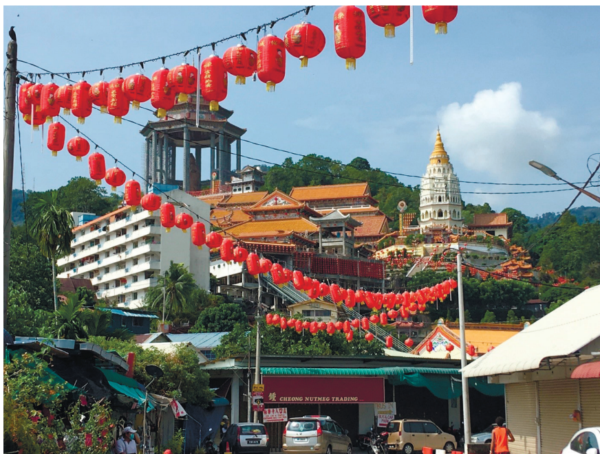
Фото 15. Статуя китайской богини сострадания и милосердия Гуань Инь в храмовом комплексе Кек Лок Си.