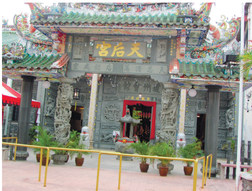
Фото 20. Даосский храм Тянь Хор Кеонг.

снова распахнула верующим свои двери. На острове действуют методистские (протестантские) церкви — Святой Троицы и в провинции Уэсли.