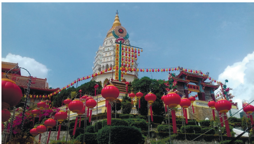
Фото 14. Храмовый комплекс Кек Лок Си.

Храмовый комплекс расположен на нескольких уровнях, в нем имеются лифт и фуникулер. Сверху открывается красивый панорамный вид на Джорджтаун и часть острова.