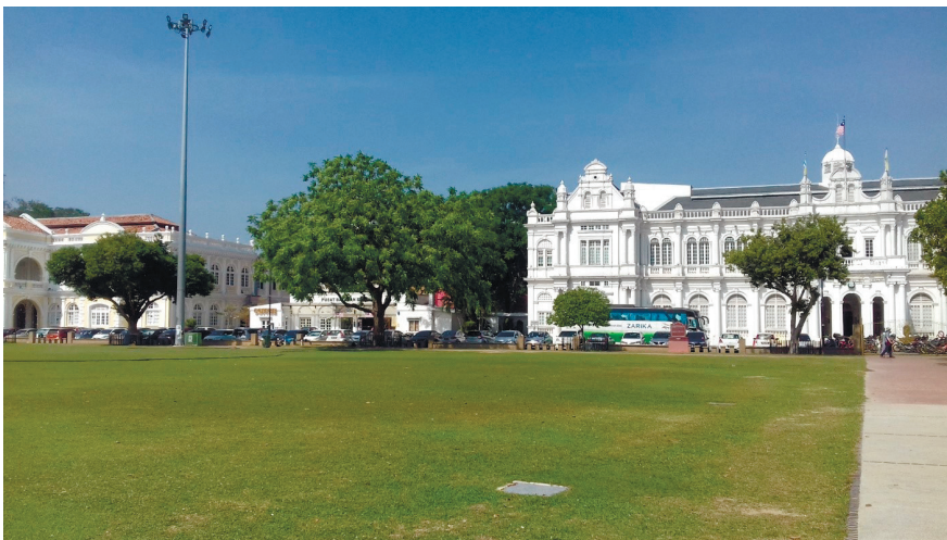
Фото 4. Старые английские колониальные постройки в Джорджтауне.

Культурно-познавательный туризм. Историческая часть Джорджтауна являет собой уникальное сочетание местных и британских архитектурно-художественных традиций, тогда как в соседней Малакке (на сайте http://whc.unesco.org/en/list — Мелака) традиции местные, голландские и португальские. Исторические районы обоих городов с 2008 г. образуют памятник Всемирного наследия ЮНЕСКО «Древние города на берегах Малаккского пролива — Мелака и Джорджтаун». Как сказано на официальном сайте организации, «Мелака и Джорджтаун получили развитие благодаря торговым и культурным обменам между Востоком и Западом, существовавшим в пределах Малаккского пролива на протяжении 500 лет. Значительное влияние Азии и Европы нашло здесь свое отражение в многокультурном материальном и нематериальном наследии... Жилые и торговые здания Джорджтауна относятся к британскому периоду, начавшемуся в конце XVIII в. Мелака и Джорджтаун являются уникальным примером архитектурных традиций и городского ландшафта, не встречающихся больше ни в одной из стран Восточной и Юго-Восточной Азии» (фото 4) [8].