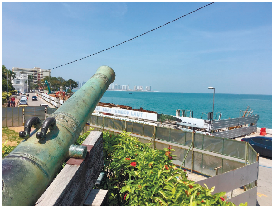
Фото 10. Вид с форта Корнуоллис.