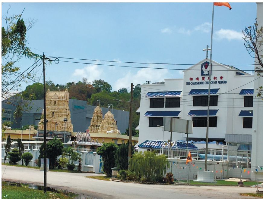
Фото 13. Мирное сосуществование храмов разных религий.