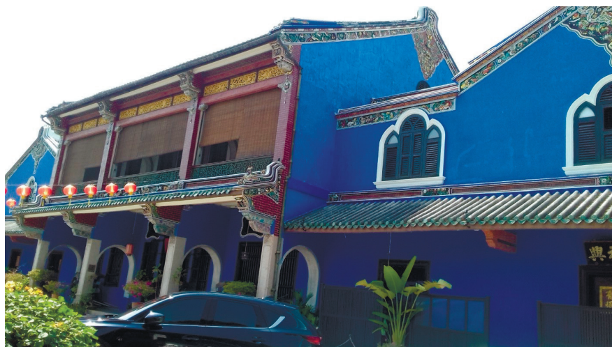
Фото 12. Голубой особняк Чонга Фатта Цзе.

Буквально в пяти минутах ходьбы от Чайнатауна (китайского квартала) находится знаменитый Голубой особняк богатого выходца из Китая XIX в. Чонга Фатта Цзе (фото 12).