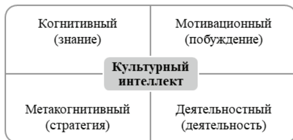
Рис. 2. Модель культурного интеллекта К. Эрли и С. Янг

Концепцию культурного интеллекта развили профессор Кристофер Эрли (P. Christopher Earley) и профессор Сингапурского технологического университета Сун Ангом (Soon Ang) в 2003 году в совместной работе «Культурная образованность: индивидуальные взаимодействия между культурами» [10]. Исследователи дают такое определение культурному интеллекту: это «возможность человека приспосабливаться к новой культуре, которая имеет отличия от его родной культуры», при этом индивид не теряет своей идентичности [13, с. 110]. Способность адаптации личности к новым культурам лежит в основе модели культурного интеллекта, состоящей из 4 компонентов (рис. 2).