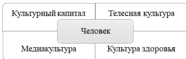
Рис. 5. Компоненты культуры человека современного мира

На рисунке 5 представлена модель, в которой суммированы рассмотренные выше характеристики культурного человека. Специалист нового цифрового общества, в том числе и специалист в области физической культуры и спорта, — это индивид, который обладает колоссальными знаниями, устойчивым культурным капиталом, постоянно совершенствующий собственную медиакультуру, развивающий телесную культуру и бережно относящийся к своему здоровью.