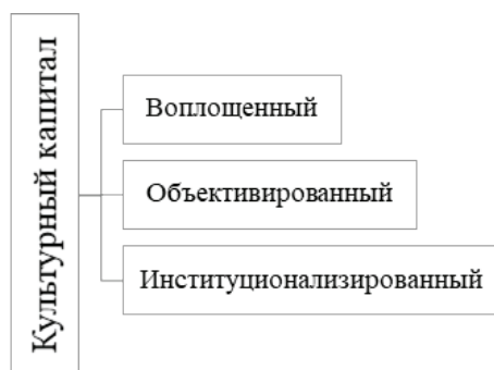
Рис. 4. Формы культурного капитала

Формирование культурного капитала зависит от многих факторов: места рождения и проживания, уровня семейной культуры и вовлеченности индивида в различные культурные практики, в том числе в разные формы социально-культурной деятельности [5, с. 122]. Культурный капитал представлен в форме ментальных, материальных и духовных традиций культуры, которые сочетают в себе знания, обычаи и ценности той или иной народности и ее культурной программы. Формы культурного капитала представлены на рисунке 4.