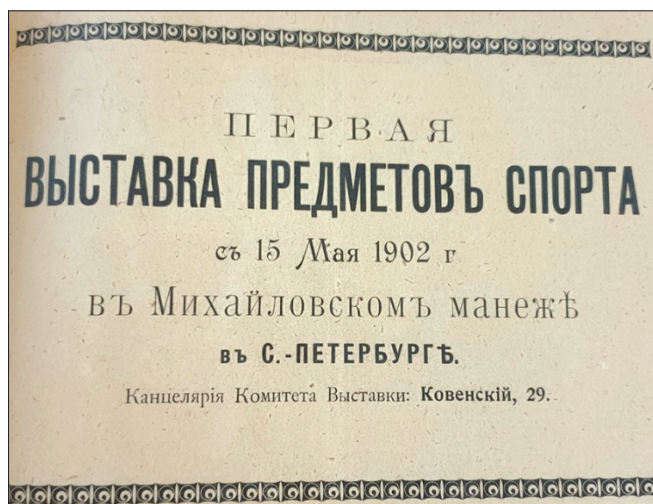
Рис. 2. Реклама выставки в журнале «Спорт», 1902, № 10.

расположения экспонентов. Но, например, площадка конюшни из Берлина, для которой все было прислано из-за границы «до единого гвоздя» и было готово раньше, чем у всех остальных, удостоилась комплимента.