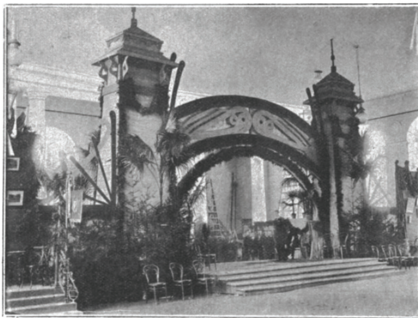
Первая всероссийская выставка предметов спорта. Входная арка.

На рисунке 2 представлена фотография Первой Всероссийской выставки предметов спорта в Михайловском манеже, опубликованная в № 22 журнала «Нива» за 1902 год.