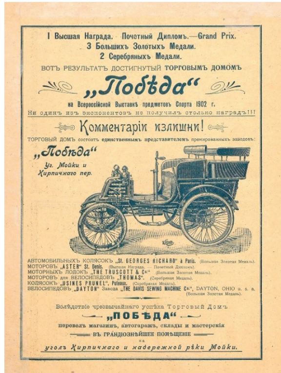
Рис. 6. Реклама в журнале «Спорт», 1902. Из фондов Российской государственной библиотеки