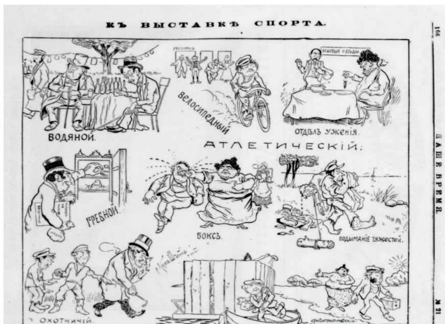
Рис. 4. Карикатура к выставке спорта. «Наше время». 1902. № 21.

Критическое настроение публикаций нарастало быстро. Мы можем даже судить об этом, рассмотрев карикатурные изображения, напечатанные в № 21 приложения «Наше время» к «Петербуржскому листку» (рис. 4) [5].