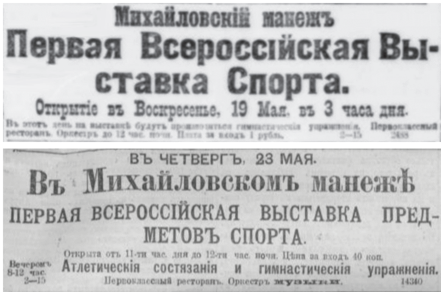
Рис. 1. Объявления о Первой Всероссийской выставке спорта в газете «Петербургский листок» от 19 (№ 135) и 23 мая (№ 139) 1902 г.

«Выставка была открыта с 11 часов дня до 12 часов ночи. Цена входного билета — 40 копеек. С 22 мая вечером с 20:00 до полуночи проходят атлетические состязания и гимнастические упражнения; на выставке работали первоклассный ресторан и оркестр музыки» [8].