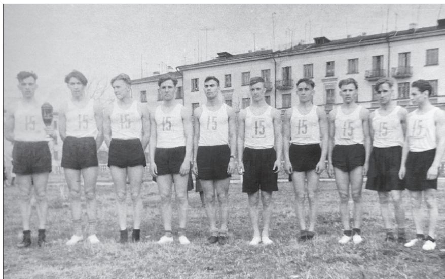
Рис. 1. Награждение студентов Ступинского техникума имени А. Т. Туманова, победителей городской первомайской эстафеты, 1960 г.